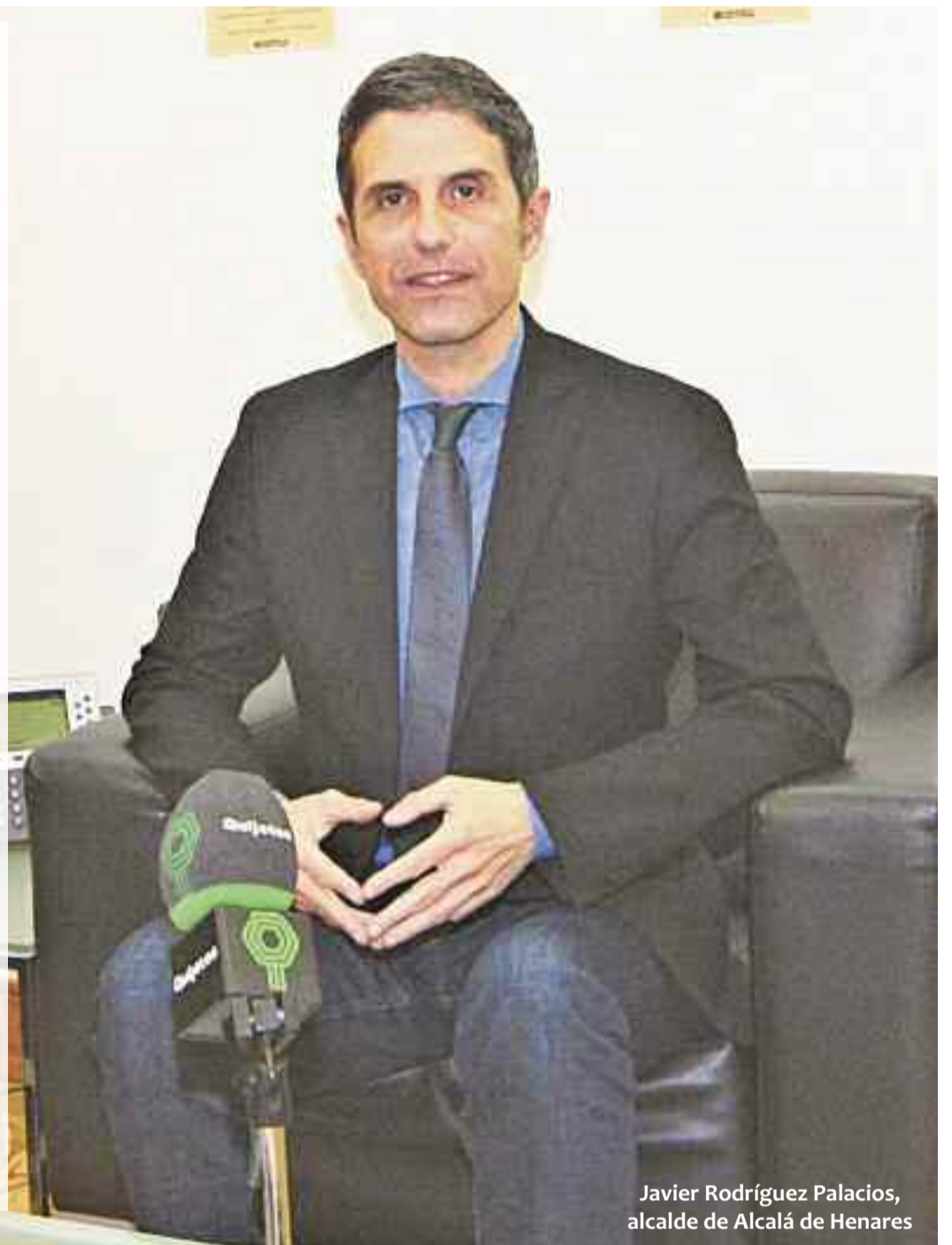
Javier Rodríguez Palacios, alcalde de Alcalá de Henares

“Estos presupuestos, nos han permitido movilizar más de 1 millón de euros en apoyo a colectivos perjudicados por el Covid-19, hemos podido realizar medidas específicas para los taxistas, para hoteles, para la hostelería, las micropymes, etc.”